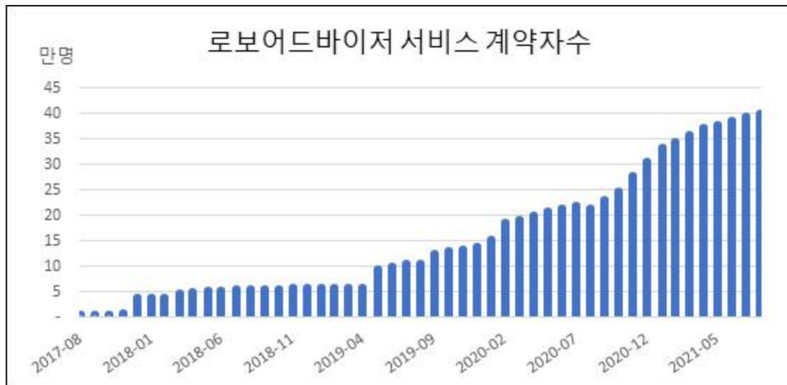
가) 업종별 계약자 수 추이