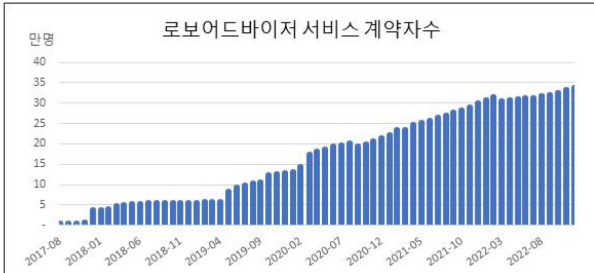
가) 업종별 계약자 수 추이